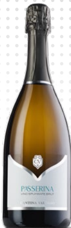
PASSERINA SPUMANTE BRUT