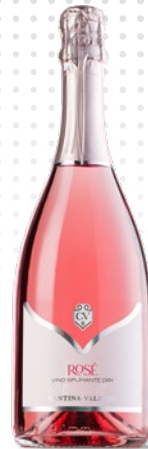
ROSÉ SPUMANTE DRY

A completamento della linea Valdaso, le bollicine trovano la loro naturale espressione. Frizzanti o spumanti, nascono da vigneti che sanno donare basi pure e vocate, trasformate in vini luminosi e armoniosi. Freschi e immediati al sorso, ma capaci di sorprendere per eleganza e persistenza, si distinguono per un'effervescenza fine e delicata, che danza nel calice e accompagna i momenti più felici da celebrare.